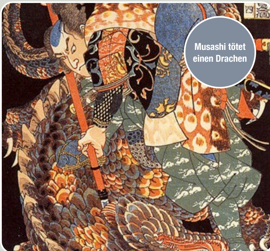
Musashi tötet einen Drachen

In den meisten Erzählungen und Berichten über Musashi findet sein für die damalige Zeit unorthodoxer Kampfstil besondere Erwähnung: Im Gegensatz zu seinen Gegnern kämpfte Musashi häufig mit zwei Schwertern. Musashi schrieb über seinen Kampfstil: „...denn wahr ist, dass man alle Waffen, die man besitzt, gebrauchen sollte, statt sein Leben wegzuwerfen. Zu sterben, mit einer unbenutzten Waffe in seinem Gürtel, das wäre bedauerlich.“